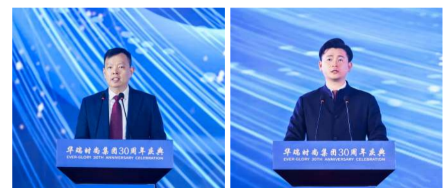
集团董事长孙家军