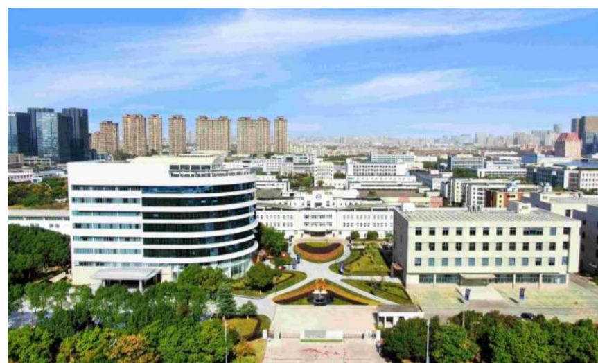
华瑞时尚集团南京总部

洪,到03年抗击非典、08年驰援汶川大地震,再到抗击新冠、脱贫攻坚路上,都有我们华瑞人的身影与奉献。三十年来我们向各界捐款超一亿二千多万元,捐物另计;捐建七所希望小学、一所寺院等。时尚产业是文化产业、创意产业,也是都市产业、科技产业、数据产业,更永远是朝阳产业!希望华瑞人继续为中国时尚产业贡献华瑞力量!