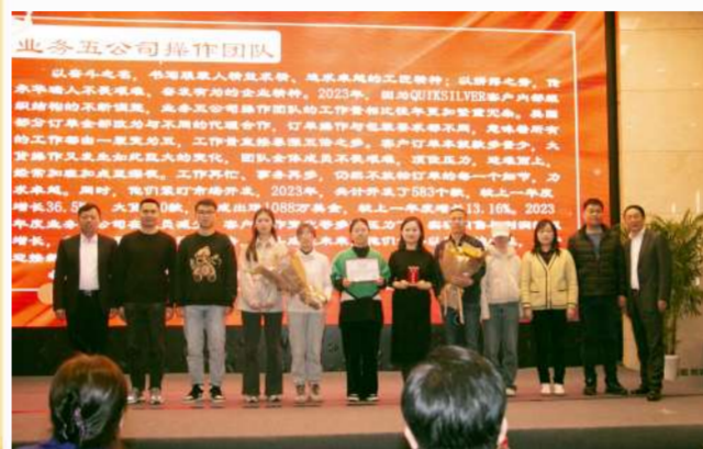
业务五公司操作团队