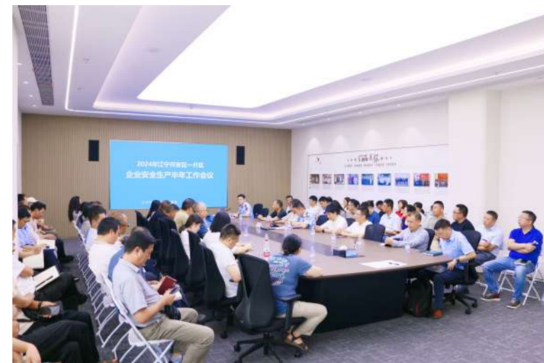
图为2024年江宁开发区一片区企业安全生产半年工作会议

7月17日下午,江宁开发区应急管理局在我司召开了“一片区2024年上半年工作总结与安全警示大会”,全面回顾上半年的安全生产成果,深刻剖析存在的问题,并对下半年工作进行科学规划与部署。来自一片区内50余家单位的安全负责人及管理人员参会。