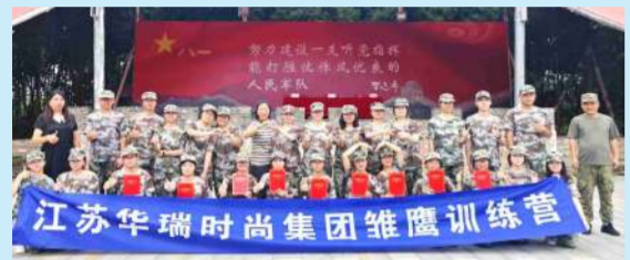
扬帆起航,成就自我

七月,热浪滚滚,华瑞的新人们却比这热度更热烈!2024年的雏鹰训练营迎来了28位满腔热血的新成员,他们背景各异、学识多元,刚迈出校门就以高昂的热情投入职场,一步步从校园精英蜕变为职场高手!