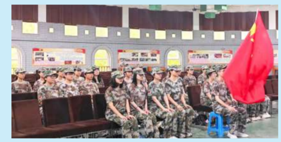
7月10日清晨,经过一夜休整,雏鹰们踏上了前往

南京市十月军校的旅程,开始了为期6天的军训。即使细雨蒙蒙,也无法浇灭他们内心的热忱。换上迷彩服,雏鹰训练营正式拉开序幕!